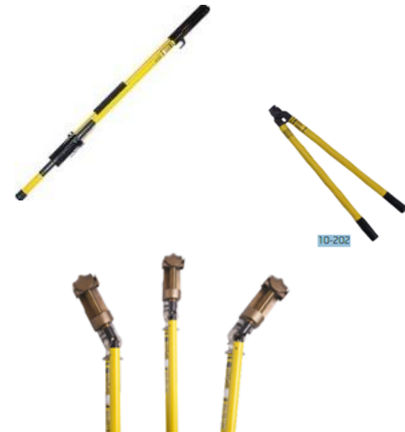
Dažādas nozīmes un pielietojuma izolējošie stieņi un vadu grieznes