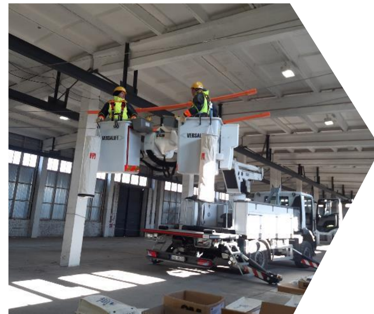
Praktisko iemaņu apguve telpās