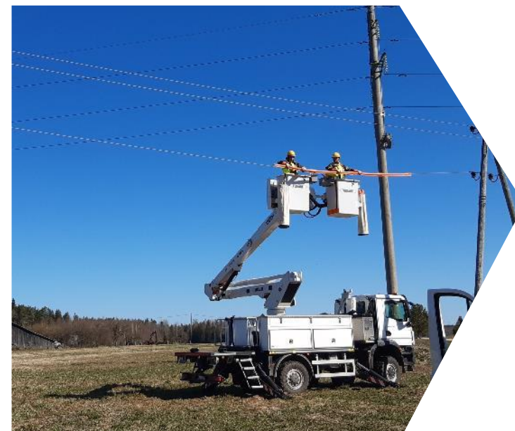
Praktisko iemaņu apguve ST elektrotīklā