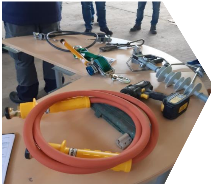
Teorētisko zināšanu apguve