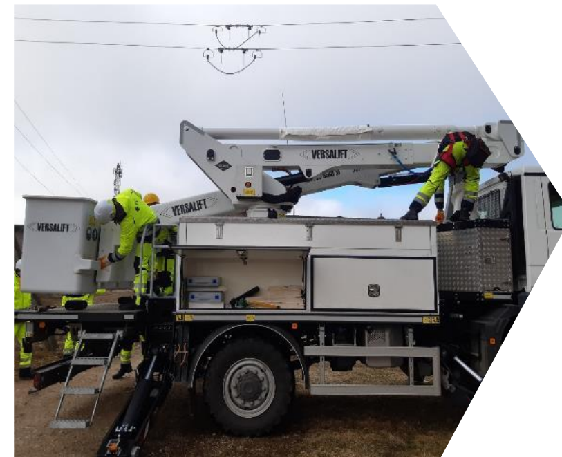
Paceļamās darba platformas apkope