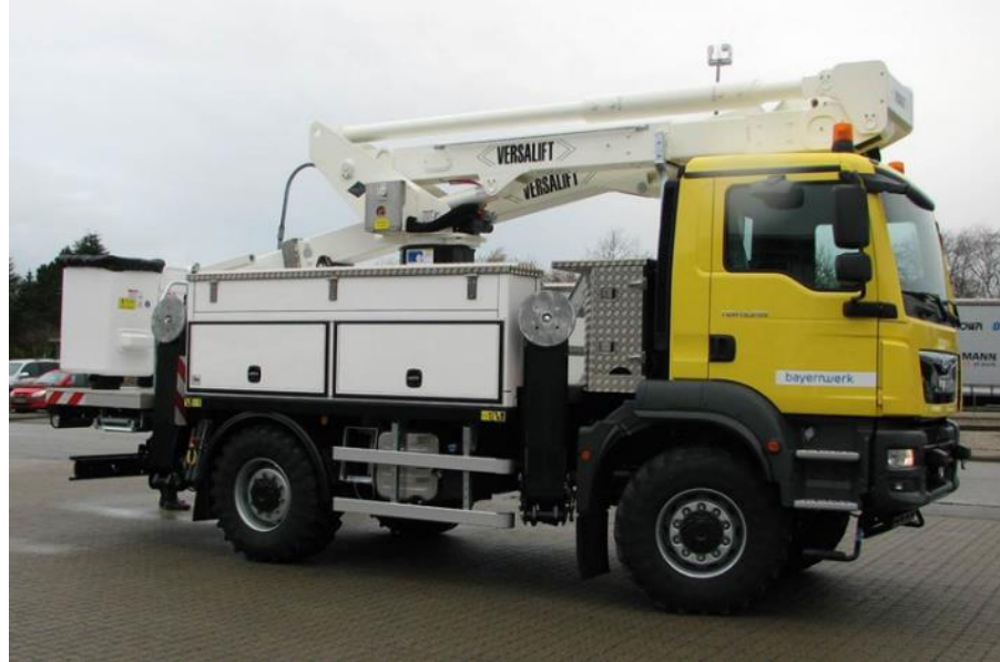
Izolējoša paceļama darba platforma