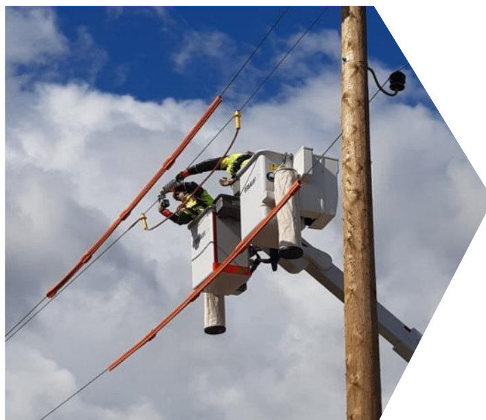
Praktisko iemaņu apguve poligonā