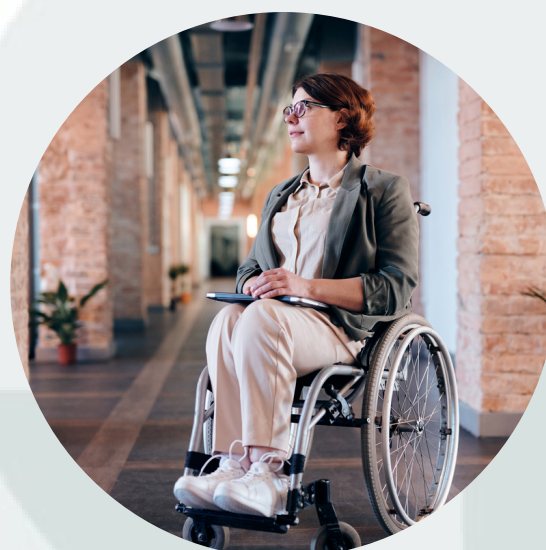
Nodarbinātie ar īpašām vajadzībām