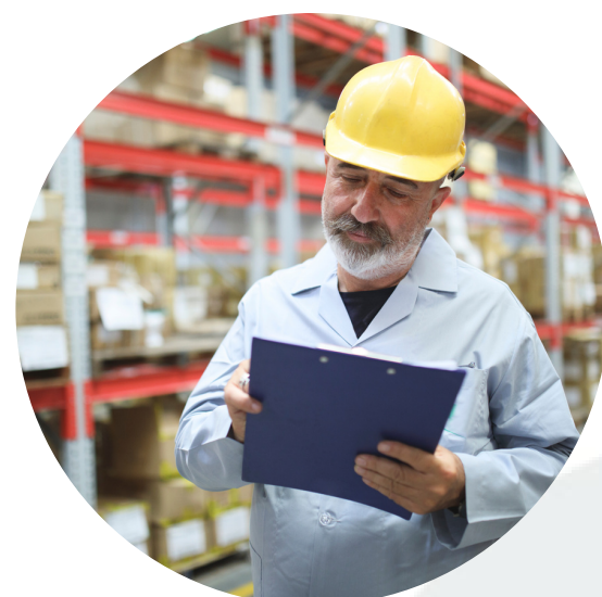
Gados vecāki darbinieki