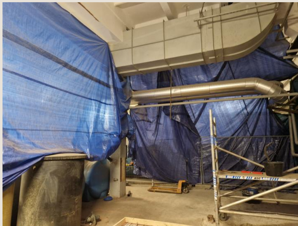
Lai remontdarbu laikā putekļi neizplatītos pa visu KM, norobežot darbu veikšanas vietu.