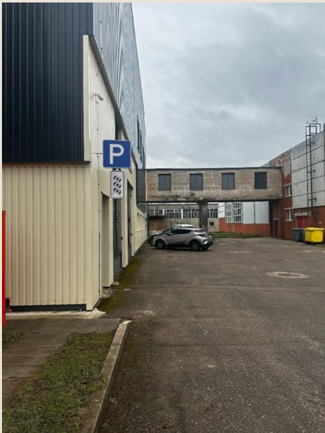
Uzstādīta zīme «Stāvvietā»