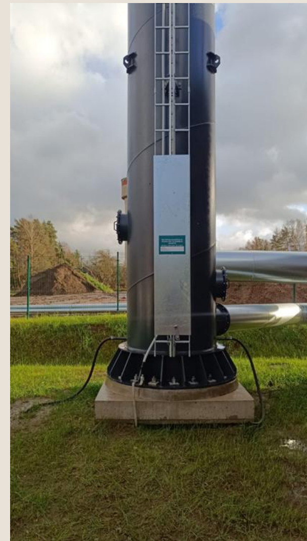
Uzstādīts aizsargs vertikālajām kāpnēm, lai izvairītos no nesankcionētas nepiederošu personu kāpšanas.